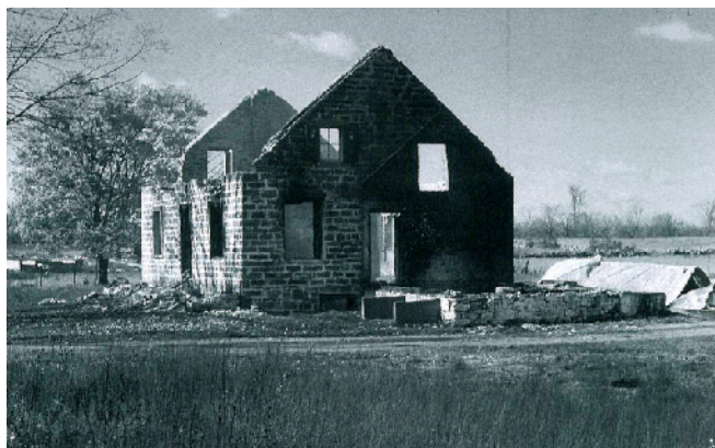
Maison ancestrale sise à Sainte-Monique, incendiée en octobre 1970 par les fonctionnaires fédéraux.

Pour en savoir plus : RAYMOND Jean-Paul, BOILEAU Gilles, La mémoire de Mirabel, Éditions Le Méridien.