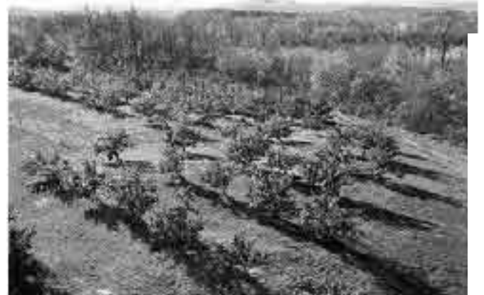
Une pommeraie de Saint-Joseph-du-Lac

La SHRDM sera l'hôte d'un important événement soit le 42e congrès de la Fédération des Sociétés d'histoire du Québec. Le congrès se tiendra dans la région des Laurentides, à l'Hôtel Mont-Gabriel de Sainte-Adèle, du 25 au 27 mai 2007. Le thème de ce congrès portera sur la place et l'importance des paysages dans l'histoire et le développement des Laurentides. Les congressistes seront alors accueillis par la Table des sociétés d'histoire des Laurentides chapeauté par le Conseil de la culture des Laurentides qui regroupe plus de 18 organismes en histoire et en patrimoine de la région. Pensez-donc à réserver cette fin de semaine qui vous permettra d'en apprendre plus sur l'histoire de la grande région des Laurentides tout en y faisant des rencontres fort intéressantes !