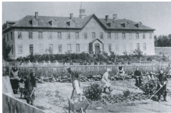
Les moines trappistes à Oka.